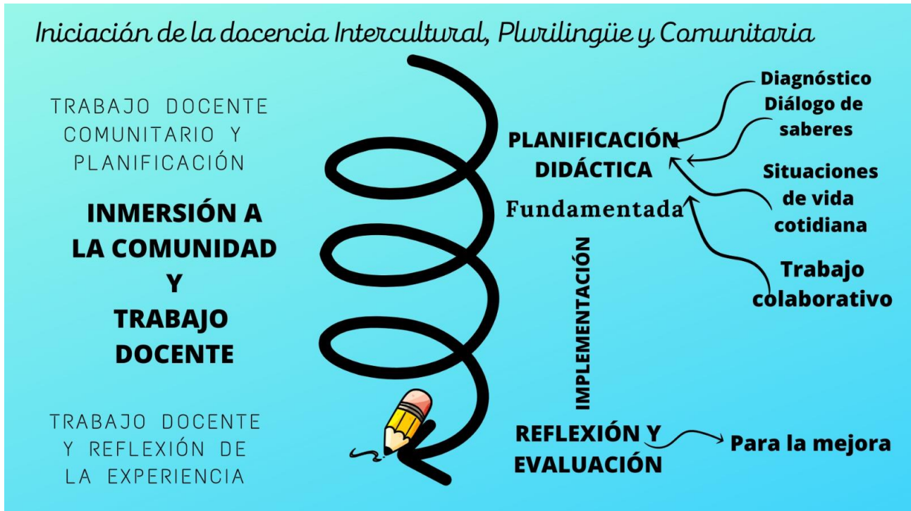
Diagrama de la unidad de estudio. (Elaboración colectiva)