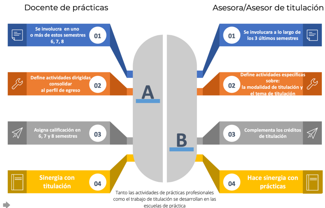
Fig. 4. Énfasis de docentes y asesores de titulación

El proceso de titulación se describe, de manera ampliada, en los documentos que están disponibles en la página de la DGEsuM titulados: