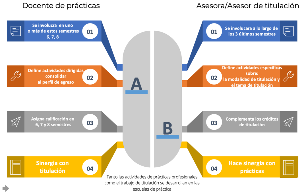
Fig. 4. Énfasis de docentes y asesores de titulación

El proceso de titulación se describe, de manera ampliada, en los documentos que están disponibles en la Página Web de la DGEsUM: