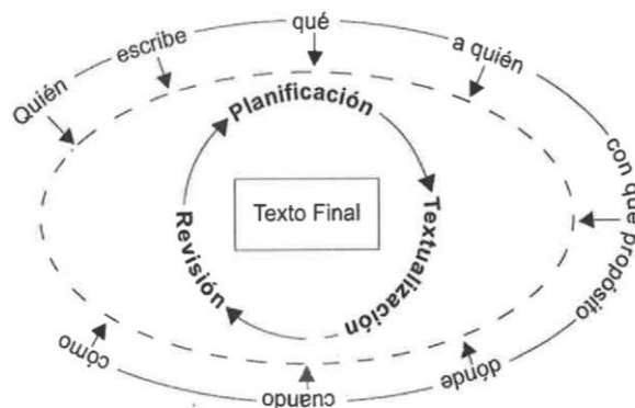
Figura 1. Esquema sociocognitivo para la producción de textos escritos (Álvarez, A. T., 2006, p. 53)

Lo anterior solamente puede ser posible cuando se asume que la enseñanza es un proceso multidimensional y por ello los temas integrados en las unidades de aprendizaje del curso deben ser abordados a través de situaciones didácticas que permitan al estudiantado normalista hacer uso del lenguaje, privilegiando el desarrollo/consolidación de la expresión escrita, a través de la interacción con tipos textuales (Flower y Hayes, 1990) de diversos géneros, tramas y funciones, de esta manera, al mismo tiempo que aborda los contenidos temáticos propuestos en el curso, tiene la posibilidad de ampliar sus competencias en la escritura.